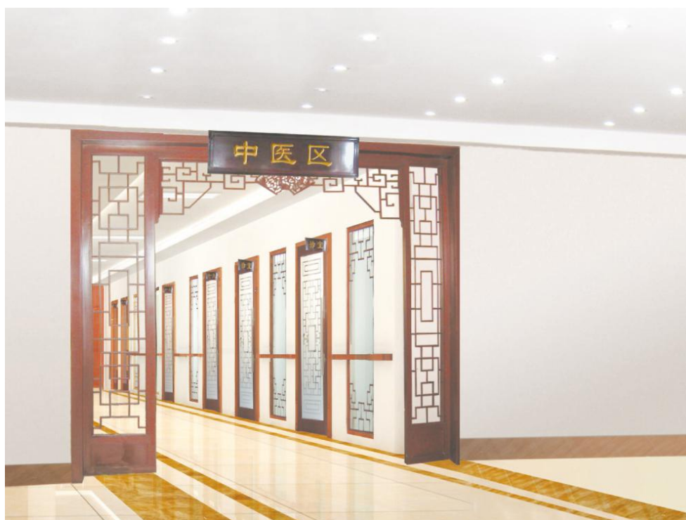
图 D.1 中医区效果图