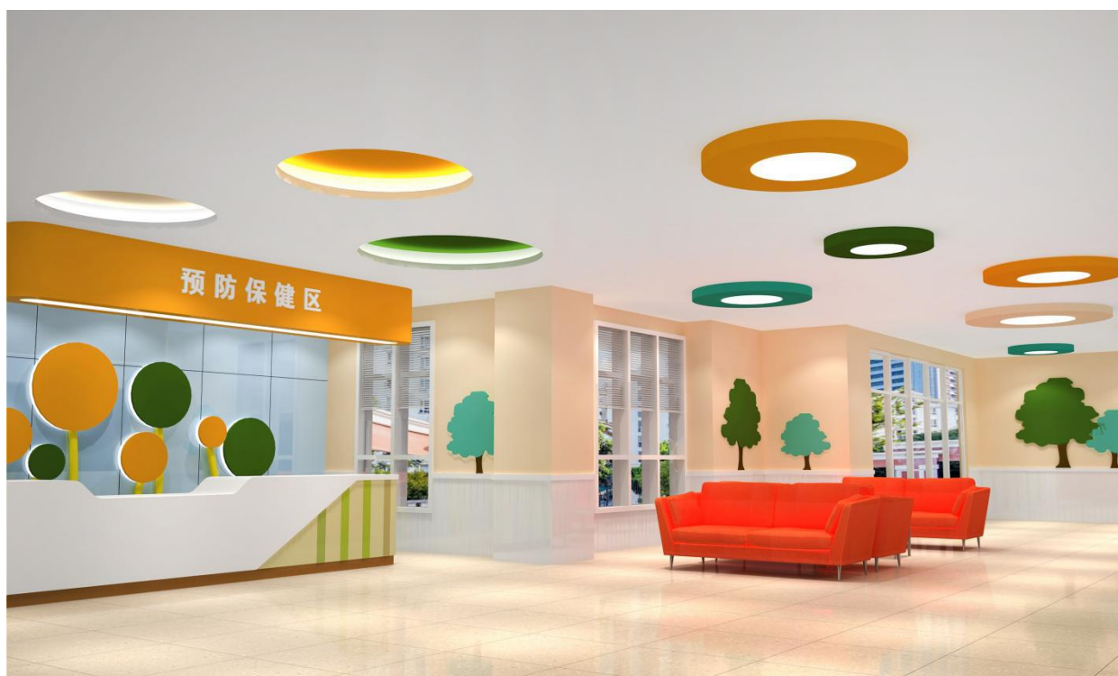
图 E.1 预防保健区效果图