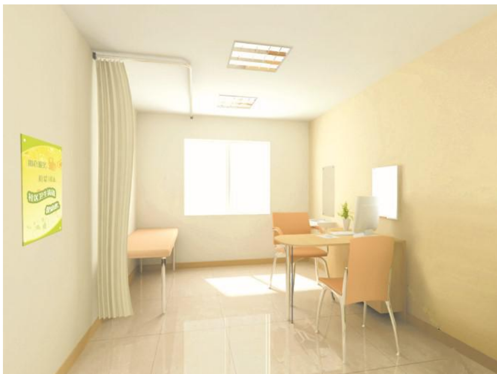
图 C.1 诊室效果图