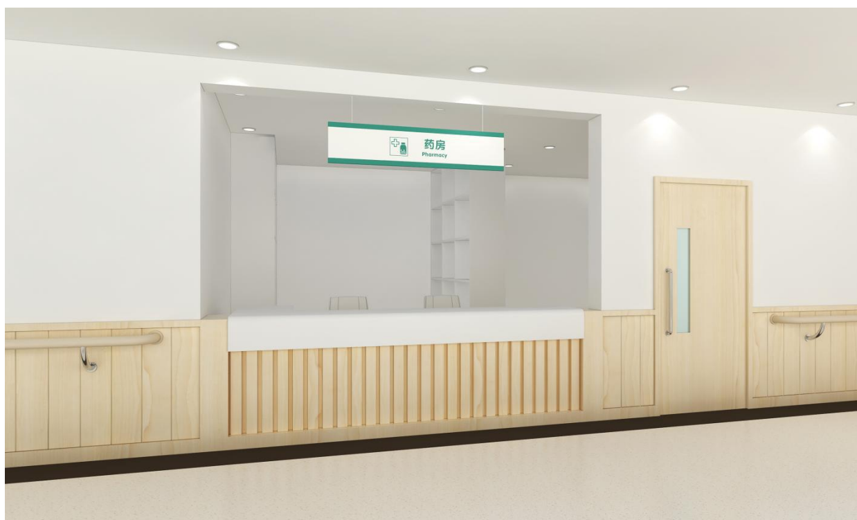
图 G.1 药房效果图