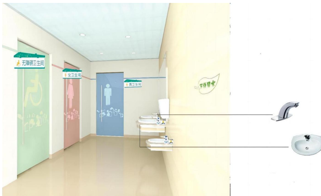
图 J.1 卫生间效果图