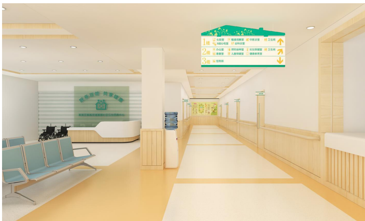
图 B.1 候诊区效果图