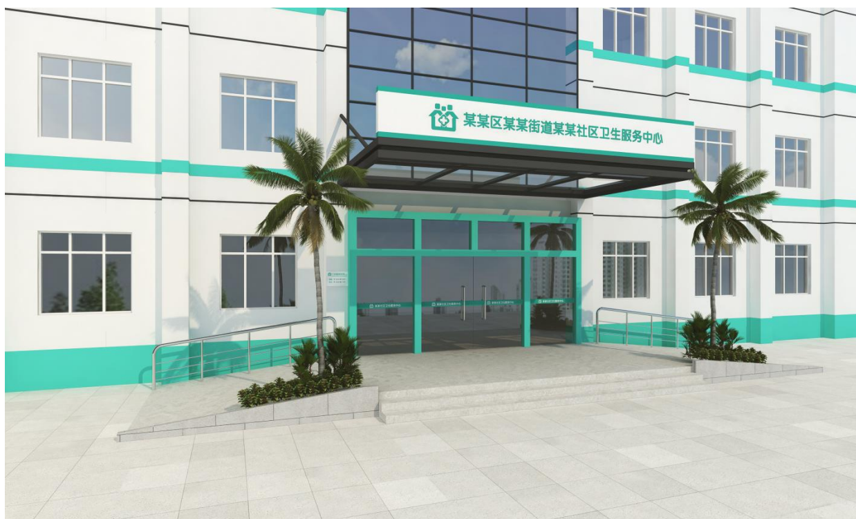
图 A.1 入口外观效果图