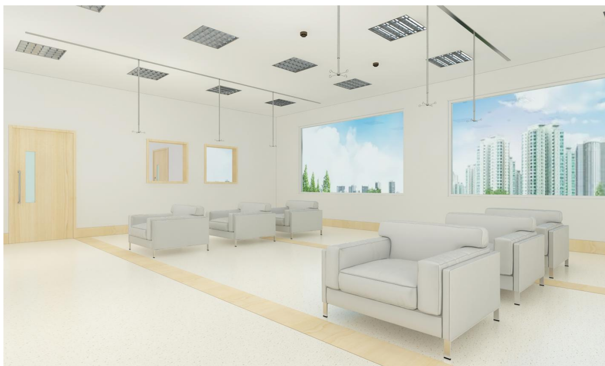
图 H.1 留观室效果图